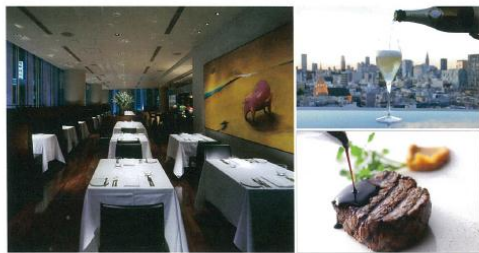
TWO ROOMS GRILL | BAR ディナーペア