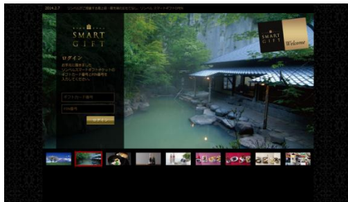
〈スマートギフト商品交換サイト〉約1万点のラインナップ