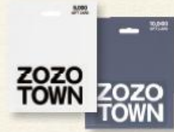
(ゾゾタウン ギフトカード)