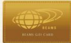
(ビームス ギフトカード)