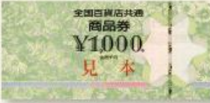
(全国百貨店共通商品券)