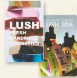
(ラッシュ ギフトカード)