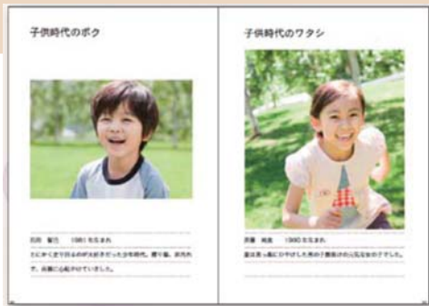
▲ オリジナル写真使用