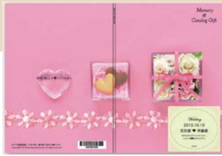
▲ 写真なしA(オリジナルテンプレート・数十種類あり)