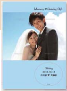
▲ オリジナル写真使用