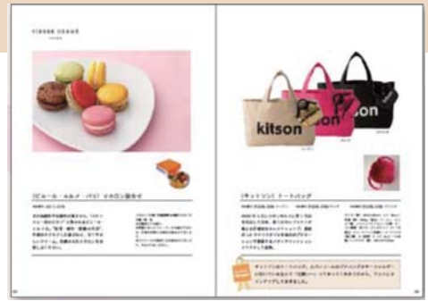
▲ オリジナル写真なし