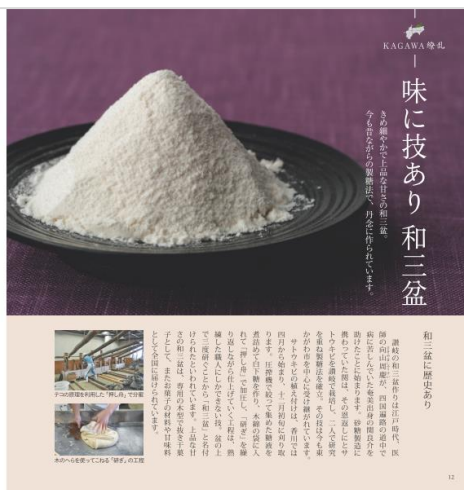
「ばいこう堂」の和三盆(左ページ)と、和三盆の特集ページ「KAGAWA 繚乱」(右ページ)