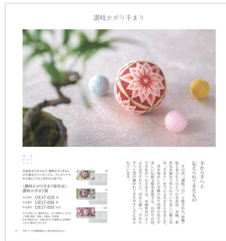
草木染めした木綿の糸で仕上げる、讃岐かがり手まり