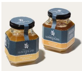
フランスの老舗はちみつ店 「ラ・メゾン・デュ・ミエル」