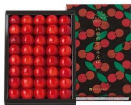
山形県産さくらんぼ 佐藤錦