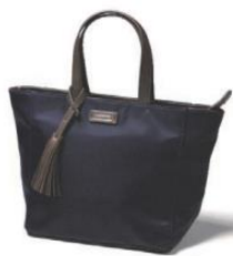
パリジェンヌの定番ブランド 「ロックスウッド」のトートバック