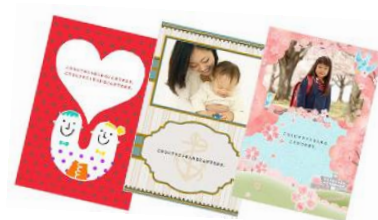
無料のメッセージカード お好きな写真を入れて 店頭で作成することも可能