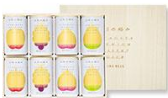
プレミアムデザートジュース

1箱1万円を超える希少な山形県産さくらんぼ 佐藤錦など、一部の食品の試食販売も実施します。