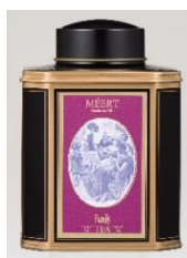
フランスの老舗パティスリー「MEERT」(メール) 紅茶とコンフィチュール