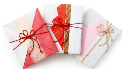
当店限定オリジナルラッピングサービス 有料(+300円)にて提供 写真はイメージとなり、現物とは異なります。