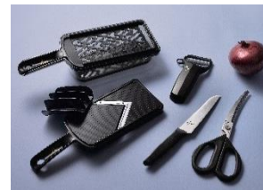
キッチンツールセット