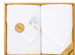
エアークワッフル タオルセット