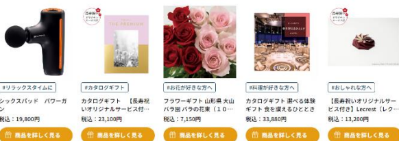
(例1) 節目別のおすすめ商品の画面(「還暦」を選択)

中国発祥の長寿祝い。干支は十二支の組み合わせで成り立っており、この組み合わせで歳を数える と60年で生まれ年の干支に戻ることに由来した、数え年60歳を迎える方の長寿祝いの名称。