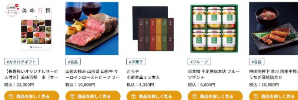
(例2) 好み別のおすすめ商品の画面