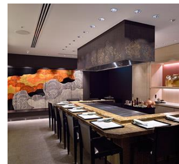
<ザ・リッツカールトン京都>