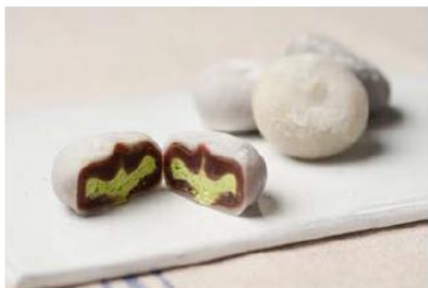
喜久福4種詰合せ 〈喜久水庵〉 ¥2,000

衆の郷、長野県小布施町にある小布施菓業の栗原ノ子と、お隣の唯一市村酒造場の純米酒のギフトセット。栗と餅で「おくります」というネーミングもシャレがきいています。