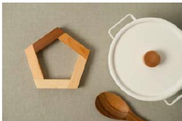
五木 銅敷き 〈asahinoko〉 ¥3,150

銀板転写による印刷の技法で絵付けしたお茶碗。ひとつひとつ手作業で絵付けしているため、微妙なズレやかすれもまた味。柄はアーティスト立花文憲さんによるデザインです。